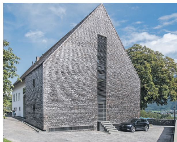
Das Liechtenstein-Institut in Bendorf.

Ein Blick in die Pilotstudie verrät, worauf Frommelt hinauswollte - ein Beispiel: Bei der Volkszählung 2015 gaben fast 92 Prozent aller 25- bis 29-Jährigen an, mindestens die Sekundarstufe II (Gymnasium oder Berufsschule) absolviert zu haben. Ein solcher Abschluss ist heutzutage das A und O für den Einstieg in die Arbeitswelt. Nun habe sich aber gezeigt, dass diese Quote bei gleichaltrigen Ausländern mit rund 80 Prozent deutlich tiefer liegt. Als Grund sieht das Liechtenstein-Institut, dass zugewanderte Personen oftmals eine geringere Vorbildung haben oder sie die Sprache nicht gut beherrschen. Ein weiteres Beispiel liefert die Pilotstudie bezüglich Geschlechterverteilung bei den Lehrberufen: Im